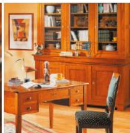
17 - JEAN-JACQUES LATAILLADE