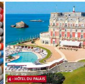
4 - HÔTEL DU PALAIS