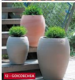
12 - GOICOECHA