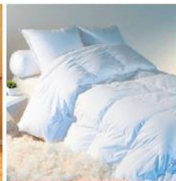
18 - MANUFACTURE CASTEX