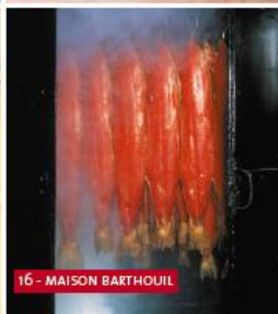
16 - MAISON BARTHOUIL