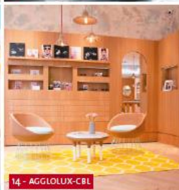
14 - AGGLOLUX-CBL