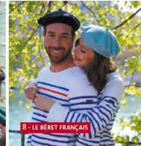
8 - LE BÉRET FRANÇAIS