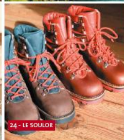
24 - LE SOULOR