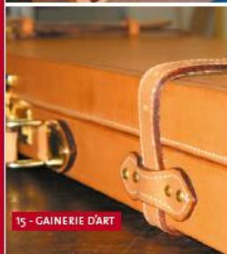
15 - GAINERIE D'ART