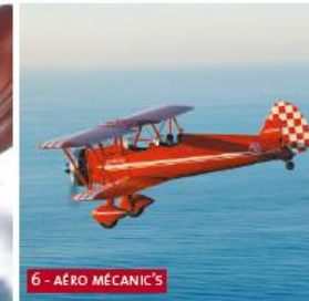
6 - AÉRO MÉCANIC'S