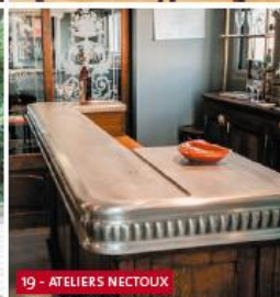
19 - ATELIERS NECTOUX