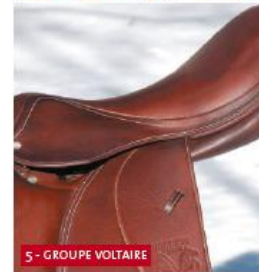
5 - GROUPE VOLTAIRE