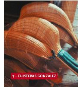
7 - CHISTERAS GONZALEZ