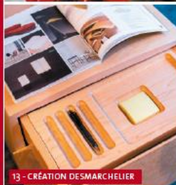
13 - CRÉATION DESMARCHÉLIER