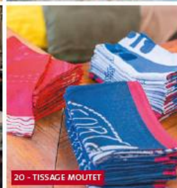
20 - TISSAGE MOUTET