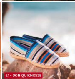
21 - DON QUICHOSSE