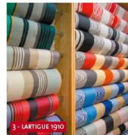
3 - LARTIGUE 1910