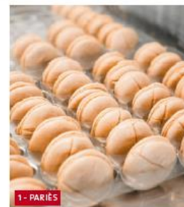
1 - PARIÉS

Chaussures de montagne et de ville Atelier de fabrication (ouvert au public) et magasin 1 Place du Maréchal de Latre de Tassigny 64800 Nay 05 59 84 03 26 lesoulor1925.com