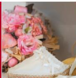
9 - L'ART DE L'ESPADRILLE

Le label EPV est une marque de reconnaissance de l'État qui distingue des entreprises françaises aux savoir-faire artisanaux et industriels d'excellence. Qu'elles travaillent le cuir, le coton, le bois ou le chocolat, ces entreprises hors du commun manient à la perfection l'art de sublimer la matière grâce à des techniques ancestrales et une innovation permanente. Elles nous racontent, chacune à sa manière, une histoire passionnante. Nous vous invitons à découvrir leurs trésors qui rendent hommage chaque jour à l'excellence artisanale et industrielle du territoire.