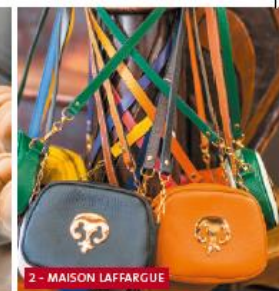
2 - MAISON LAFFARGUE